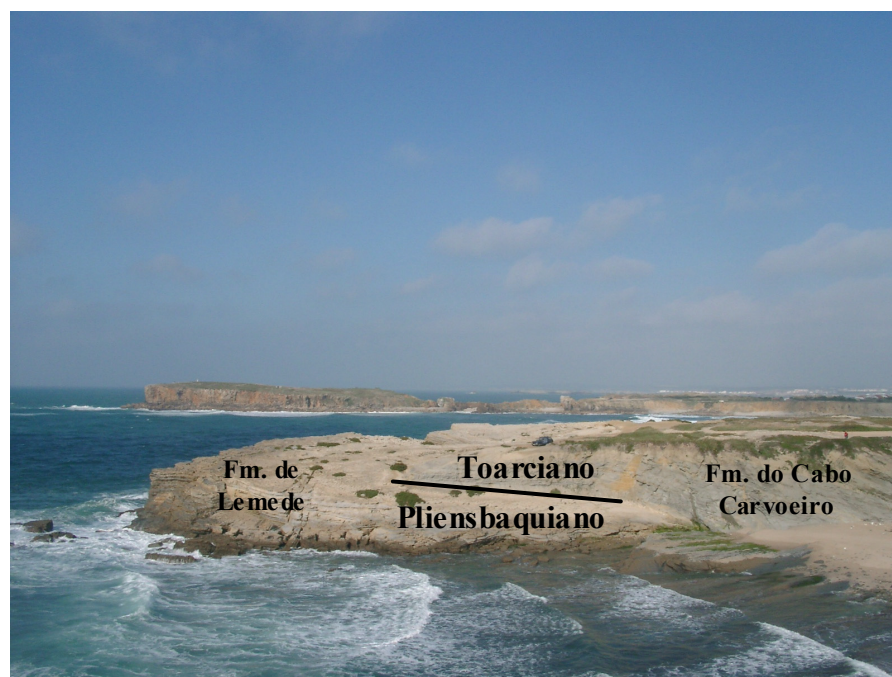
Fig. 4 – O limite Pliensbaquiano-Toarciano no perfil de Peniche (Ponta do Trovão) e seu enquadramento litostratigráfico. A definição deste limite deve-se a estudos de biostratigrafia de amonites ( vide Mouterde, 1955; Elmi et al., 1996; Elmi, 2002).

As recentes propostas de Elmi et al. (1996) e de Elmi (2002), catapultaram o interesse do afloramento de Peniche para a alta esfera da Comissão Internacional de Estratigrafia. Assim, de entre um conjunto de restritas hipóteses, enunciadas em Elmi (2002), o perfil de Peniche é hoje o que melhor condições reúne para o estabelecimento do GSSP (Global Boundary Stratotype Section and Point) do Toarciano. O limite Pliensbaquiano/Toarciano (Fig. 4), enquadrado numa sucessão estratigráfica praticamente contínua entre o Sinemuriano e a base do Dogger, demonstra o valor supra-nacional deste local (Duarte, 2003, 2004; Henriques, 2002).