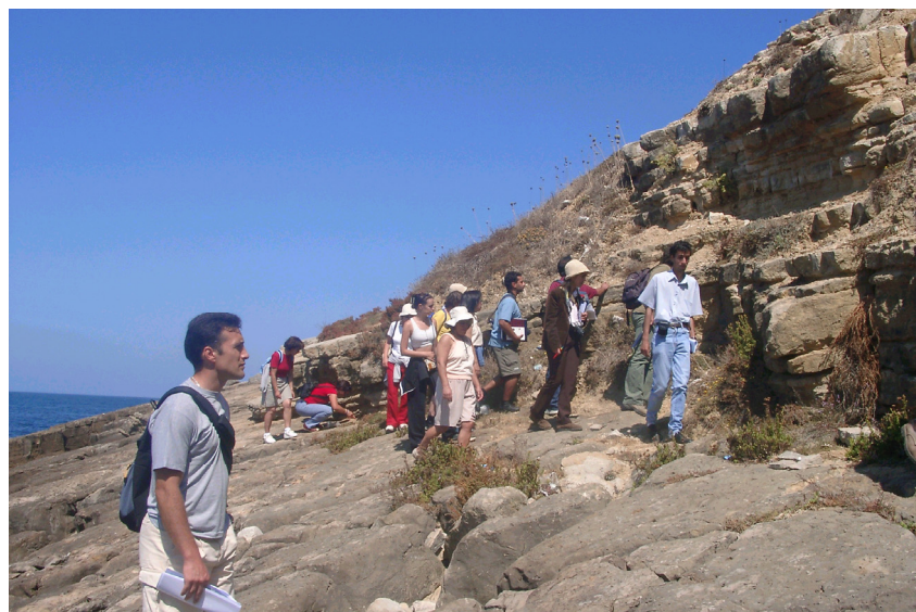
Fig. 5 – Saída de campo realizada em Peniche, em Agosto de 2002, no âmbito do Programa Geologia no Verão (Geologia à beira-mar: Histórias geológicas de Peniche). A elevada participação comprova o interesse do cidadão comum pela singularidade destas falésias calcárias.

Natural. Para além do valor nacional e supra-nacional, estes factos, justificam, no modelo quantitativo de Elizaga-Muñoz (1988), o interesse geológico local e regional.